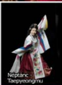
Néptánc - Taepyeongmu